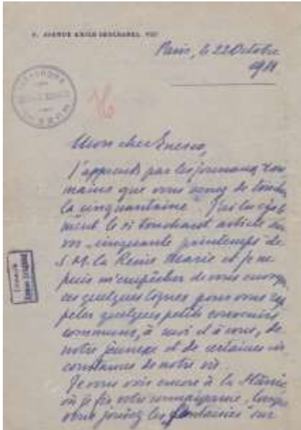
Figura 2. Scrisoare. Eugeniu Neculcea cătore George Enescu, p. 1 (Arhiva MNGE)

Eugeniu Grigore Neculcea (1876-1954) conturează prin prisma cuvintelor așternute pe hârtie în anul 1931 întâmplări de demult, experiențe trăite alături de George Enescu de-a lungul vieții lor, filtrate, desigur, de amintirile subiective ale destinatarului. Muzicianul, afirmat și consacrat ca personalitate a vieții muzicale românești și internaționale, împlinea în anul 1931 o jumătate de veac. Cu acest prilej, primea mesaje de felicitare având ca expeditori diferiți reprezentanți ai artelor și culturii europene, cum este cazul lui Eugeniu Gr. Neculcea. Din scrisoarea sa aflăm fapte diverse: că l-a întâlnit pe George Enescu la Slănic, apoi că părinții lor se cunoșteau și, în cele din urmă, auzindu-l pe micul muzician cântând la vioară în casa părinților săi, și-a dorit și el să studieze acest instrument. Știm că în 1888, Enescu a fost înscris ca elev la Conservatorul din Viena, iar un an mai