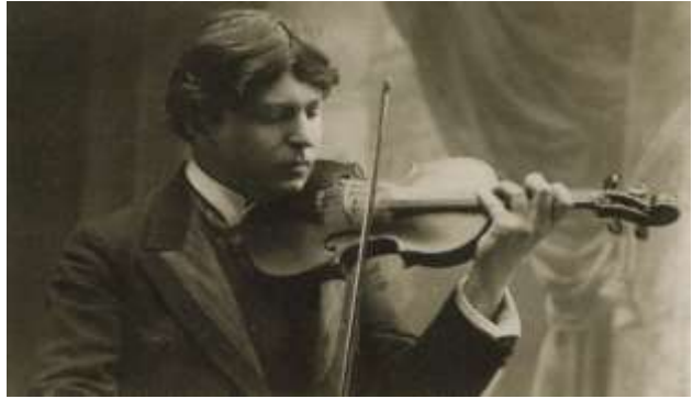
Figura 4. George Enescu, violonist

Așadar, iată un moment inedit din biografia lui George Enescu, strecurat printre amintirile unui compatriot, nedatat, dar situat, cel mai probabil în jurul anilor 1913-1914, când pianistul spaniol ar fi făcut posibil un concert dedicat în întregime creației lui Granados (la 4 aprilie 1914), organizat de către Société Musicale Indépendante din