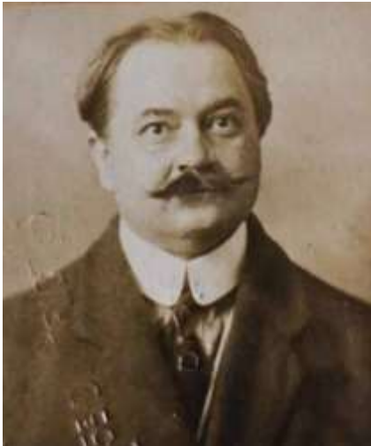
Figura 1. Fotografie Eugeniu Grigore Neculcea

De-a lungul timpului, destinele acestor doi oameni de cultură s-au intersectat; primul – muzician notoriu, al doilea – Doctor în științe fizico-matematice la Sorbona, Profesor la Universitatea din Iași, care a activat în Ministerul Finanțelor, fiind, printre altele, ministru plenipotențiar al României și cadru diplomatic al Statului Român, numit, după Primul Război Mondial, membru al delegației României la Conferința de Pace de la Paris 1 . Grație faptului că întâlnirile lor au fost consemnate într-un document semnat, datat dar și păstrat, ne putem bucura acum de atmosfera specială evocată, care îl aduce în prim-plan pe George Enescu.