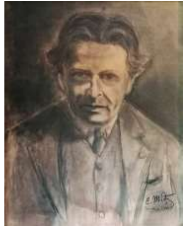
Figura 7. Portret în cărbune semnat C. Motăș, 1944

Punctul comun al celor două personalități ale culturii și științei românești, Enescu – Motăș, pare să fi fost Sinaia. Vila „Luminiș” – casa construită de muzician la poalele Carpaților – este totodată locul unde se păstrează o lucrare de artă plastică semnată Constantin Motăș și datată 1944. Amator pasionat de pictură, el a realizat portretul compozitorului, care poate fi și azi admirat pe unul dintre pereții sufrageriei vilei acestuia. Este o compoziție expresivă, în cărbune, ce îl immortalizează pe George Enescu la vârsta de 63 de ani. Activând ca director al Stațiunii Zoologice de la Sinaia începând cu anul 1940, se presupune că C. Motăș ar fi fost musafirul lui George Enescu la Vila „Luminiș” în acest răstimp, lăsându-i ca amintire un portret finalizat cu doi ani înainte de plecarea definitivă din țară a maestrului.